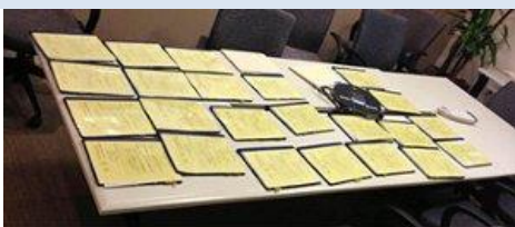
About half of the state registration paperwork GuideStar files annually

39 американских штатов требуют от фандрайзеров официальной регистрации, и при этом каждая территория выдвигает свои правила. А с развитием практики сбора средств на просторах интернета ситуация стала еще сложнее. Чтобы навести в этой сфере относительный порядок и упростить процедуры, эксперты Межрегионального портала регистрационного учета (MRFP - The Multistate Registration and Filing Portal ) предложили разработать единую национальную систему, аккумулирующую сведения обо