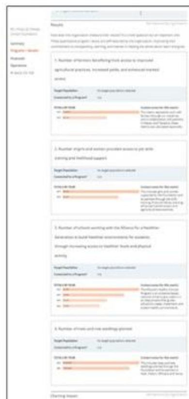
Информация агентства GuideStar о Фонде Клинтонов