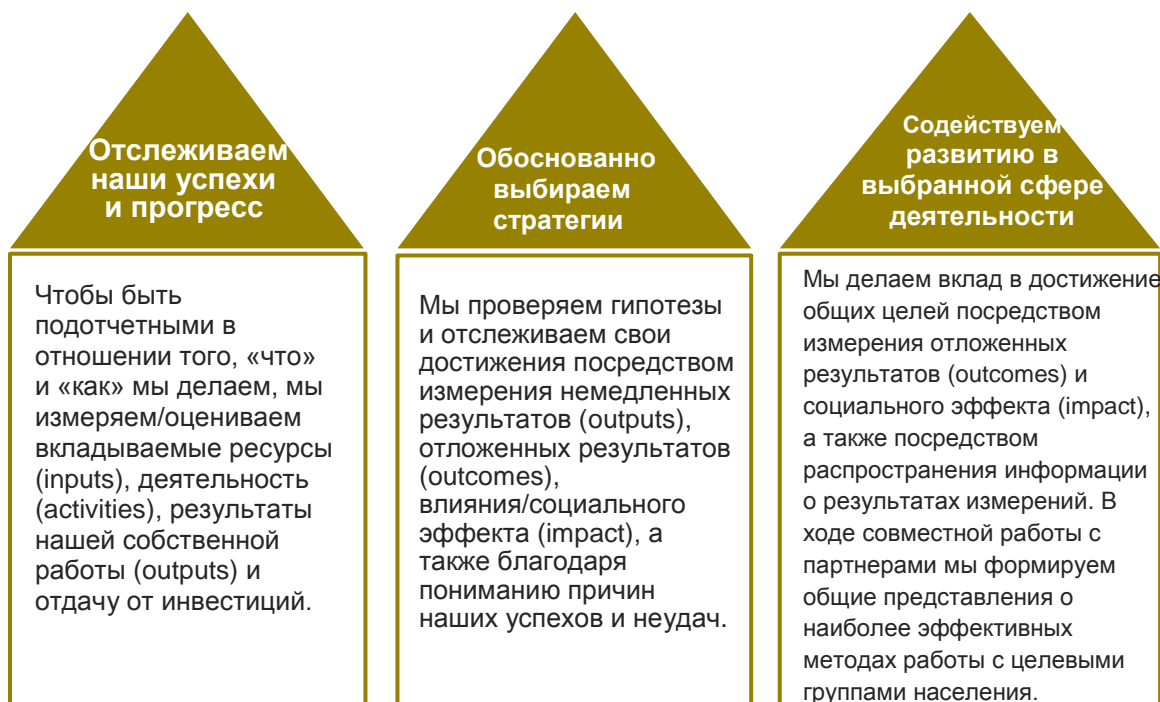
Схема 1: Измерение для практических целей – движущая сила улучшений в нашей работе